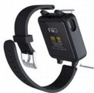
FiiO SK-M5A Cinturino Cover Dedicata Protettiva per Lettore M5