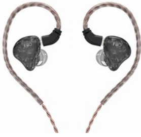
FiiO FH1S Auricolari In-Ear 2-Driver Ibrido Cavo Staccabile