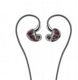
FiiO FX15 Auricolari ibridi con driver elettrostatico