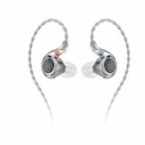
FiiO FD11 Auricolari In-Ear Driver Dinamico 10mm + Cavo Staccabile da 0,78 mm