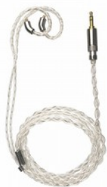
FiiO LC-RD Cavo per IEM in Argento Connettori Intercambiabili 3.5/2.5/4.4mm