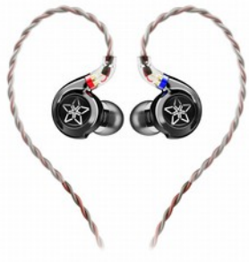
FiiO FH11 Auricolare In-Ear Ibrido Dinamico + Armatura Bilanciata

L' FH1S è un auricolare di nuova concezione che prende come base l'originale FiiO FH1, a sua volta molto apprezzato nella comunità audio, migliorando ulteriormente il suono e portandolo a livelli superiori. Rispetto all'FH1, l'FH1S ha un driver dinamico più grande, combinato con un driver di armatura Knowles bilanciato, per bassi davvero profondi, medi e alti sorprendentemente chiari e voci commoventi.