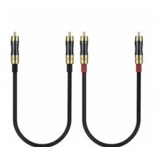
FiiO LR-RCA2 Coppia Cavi di Segnale RCA 0.5m