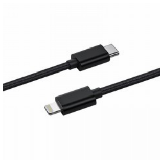
FiiO LT-LT1 Cavo Adattatore USB Type- C Lightning