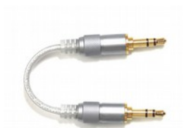
FiiO L16 Raccordo cavo audio 5cm minijack