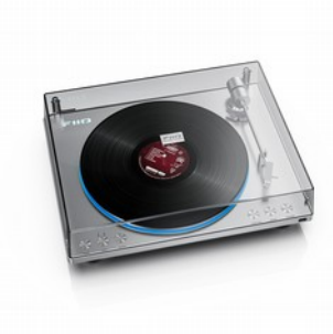
FiiO TT13 Giradischi Automatico