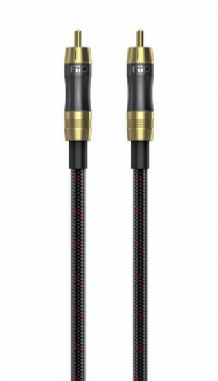
FiiO LR-RCA1 Cavo Digitale Coassiale RCA 0.5m

*Disabilita la ricarica USB dei dispositivi FiiO tramite l'app di controllo FiiO per una migliore esperienza.