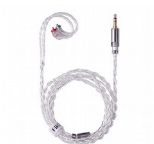
FiiO LC-RB Cavo per IEM MMCX Connettori Intercambiabili 3.5/2.5/4.4mm