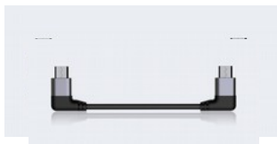
FiiO ML06 Cavo MicroUSB / MicroUSB