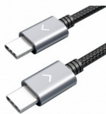
FiiO LT-TC1 cavo USB Type-C to Type-C