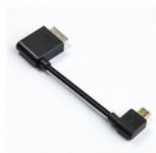
FiiO L27 Cavo Adattatore Audio Digitale da Sony WMport a MicroUSB