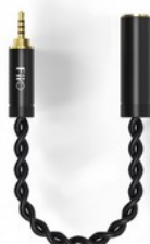
FiiO LB-4.4M adattatore minijack bilanciato per cuffie

FiiO LL-4.4M è un cavo bilanciato di alta qualità con jack maschio da 3.5mm ad un dispositivo che accetta il collegamento con jack 4.4mm femmina. Lungo soltanto 8cm (connettori esclusi), don doppi intrecciati, utilizza filo in rame ad alta purezza, HPC-23T, avvolto in pele TPE.