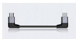
FiiO CL06 Cavo TypeC / Micro USB