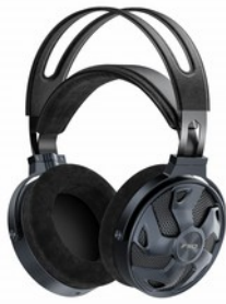
FiiO FT3 Cuffie Over-Ear dinamiche ad alta risoluzione