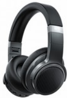
FiiO EH3NC Cuffie Wireless Stereo Elimina-Rumore

La JT1 si compone di un archetto in acciaio inossidabile, accoppiato con cavità in ABS leggero che ospitano i driver, che sono coperti da una copertura cava in alluminio a forma di stella. Si tratta di un design leggero, semplice ma elegante, pratico e attraente tempo stesso.