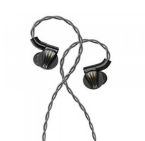
FiiO FD7 In-Ear Driver dinamico con diaframma in puro berillio