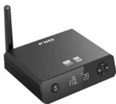
FiiO BR13 Ricevitore Bluetooth Hi-Res