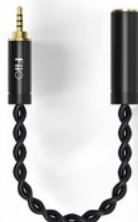
FiiO LL-4.4M adattatore minijack bilanciato per cuffie