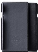
FiiO SK-M11 Cover in ecopelle per FiiO M11