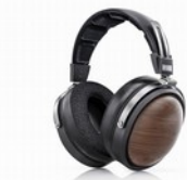
FiiO FT1 Cuffie Over-Ear Closed-Back dinamiche ad alta risoluzione

Le FiiO FT3 sono le attesissime Cuffie Over-Ear dinamiche ad alta risoluzione di FiiO. Le FT3 sono state progettate con l'obiettivo di raggiungere un suono eccezionale, e per questo dispongono di un'impedenza di 350 \Omega . Rispetto alle cuffie a bassa impedenza, le cuffie ad alta impedenza filtrano in modo più efficace il rumore per l'ascoltatore, ottenendo un suono più puro con prestazioni di rapporto segnale-rumore più elevate. La bobina mobile è realizzata in alluminio ultra fine giapponese rivestito in rame con uno spessore di soli 0,035 mm di diametro. Questa bobina mobile più fine consente al driver di seguire meglio e più rapidamente i segnali, ha capacità anti-interferenza e consente dinamiche fragorose su un'ampia gamma di risposta in frequenza.