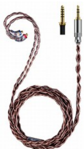
FiiO LC-RC 2024 Cavo per IEM MMCX in rame monocristallino Furukawa

Connettore (estremità sorgente): intercambiabile da 3,5 mm single-ended/2,5 mm bilanciato/4,4 mm bilanciato