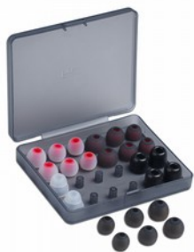
FiiO HS19 Kit Ear Tip di ricambio per auricolari FiiO (Set di 12)