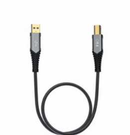
FiiO LA-UB1 Cavo audio da USB-A a USB-B

FiiO L17 è un cavo audio stereo con connettori da 3.5mm ( minijack) maschio-maschio a "L" ( angolazione 90 gradi). Impiega i pregiati conduttori OFC tipo PCOCC-A di Furukawa Electric, per una trasmissione pulita del segnale . Lunghezza del cavo 5.5cm ( escluso i connettori) e risulta perfettamente adatto per i collegamenti tra apparecchi portatili sovrapposti.