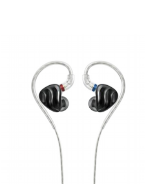
FiiO FH3 Auricolari In-Ear Monitor Triplo Driver Ibrido

il team di sviluppo di FiiO ha creato gli FD11 come parte di una nuova serie di prodotti "Bionic conch" (trad. "conchiglia bionica") che mira a superare la sua classe di prezzo sia nell'estetica che nel suono. Sono state utilizzate tecniche di fascia alta per creare il senso unico di flusso che l'FD11 irradia dal loro aspetto, e caratteristiche innovative come il flauto acustico a forma di C elevano la qualità del suono al livello successivo dando un suono veramente "coeso e unificato". Gli FD11 si concentrano sul timbro del driver dinamico, con particolare attenzione alla voce, adatto a vocal-heavy, folk, ACG e altri stili musicali. Diaframma a base di carbonio da 10 mm.