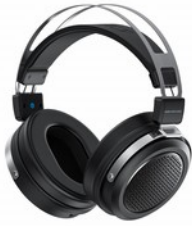
FiiO JT1 Cuffie Over-Ear dinamiche