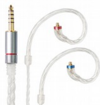
FiiO LC-2.5C / LC-4.4C / LC-3.5C Cavo speciale bilanciato / single-ended

Il cavo per cuffie IEM FiiO LC-RC 2024 è realizzato con rame monocristallino Furukawa di alta purezza, importato dal Giappone e noto per le sue eccezionali prestazioni acustiche. Il cavo presenta un design raffinato con fili in rame monocristallino Furukawa ad alta purezza. La struttura intrecciata coassiale migliora l'immagine sonora e la risoluzione, mentre i connettori MMCX estesi assicurano connessioni stabili. Il cavo include connettori intercambiabili da 3,5 mm (non bilanciato) e 4,4 mm (bilanciato), aggiungendo versatilità.