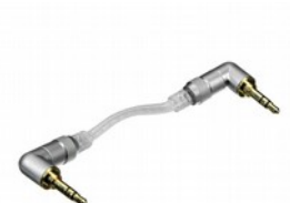
FiiO L17 Raccordo cavo audio a "L" 5cm minijack

FiiO L16 è un cavo audio stereo con connettori da 3.5mm ( minijack) maschio-maschio. Impiega i pregiati conduttori OFC tipo PCOCC-A di Furukawa Electric, per una trasmissione pulita del segnale . Lunghezza del cavo 5.5cm ( escluso i connettori) e risulta perfettamente adatto per i collegamenti tra apparecchi portatili sovrapposti.