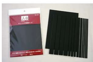
"fo.Q" Damping Tape for Tuning TA-102 Adesivo antivibrazioni