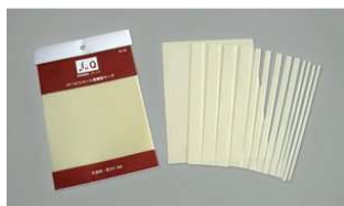
"fo.Q" Thin Tape for Tuning TA-52 Adesivo antiv. di precisione